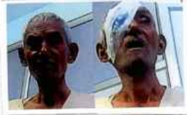
Preop 1151 Postop Bhulluram

PERMANENT RESIDENCE ADDRESS: स्थाई आवासीय पता As above